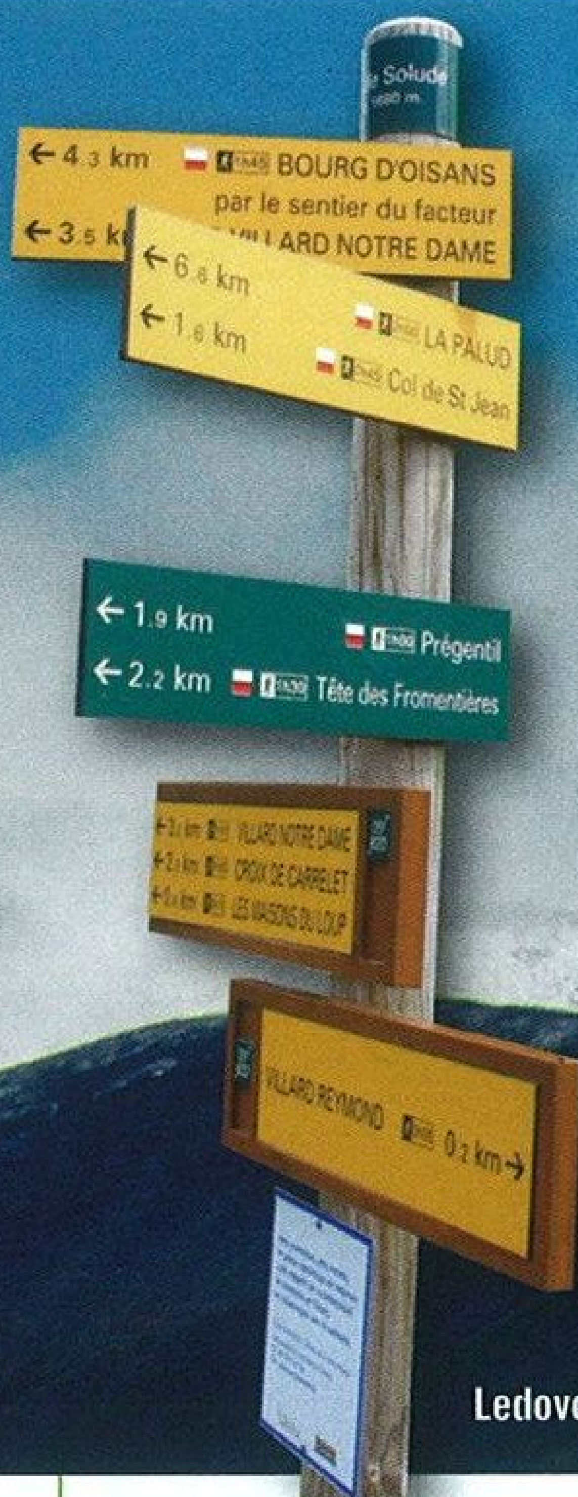
Ledovce nad Plateau d'Emparis vidíme z Villard Notre Dame směrem na severovýchod

v jediné kavárně této kamenné vesnice. Nutno podotknout, že z její terasy jsou impozantní výhledy na vzdálené ledovce. Vedlejším cílem bylo zjistit od paní domácí, zda se dá jet dál. Po vyslovení dotazu hned řekla, že ano, ale ještě se pro jistotu podívala na naše kola. Že dál prý už nevede asfalt, ale jet se dá docela dobře, a na našich pláštích úplně v pohodě.