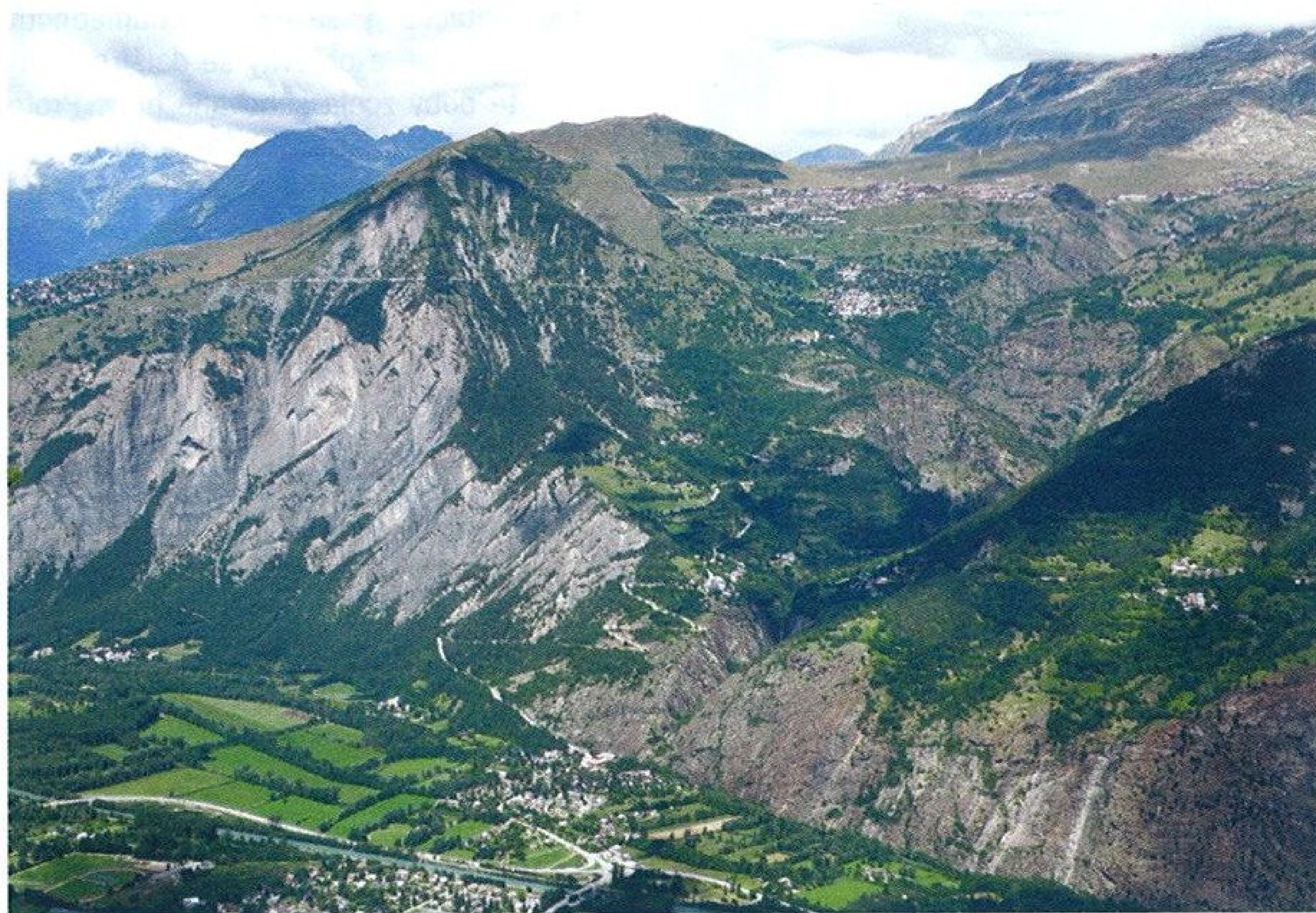
Bourg d'Oisans a serpentiny do Alpe d'Huez aneb letecký pohled z naší hřebenovky

Hned vzápětí vjíždíme do obce Villard-Reymond. Tedy ne tak úplně do ní. Silnice, opravdu už opět asfaltová, ji objíždí zprava. Jinak je to sjezd jedna radost, zpočátku však dost brzdíme, abychom mohli fotit. A zase jsou tu jiné výhledy! Nekonečná krása! Já navíc fotím dvojici před chvílí zmiňovaných