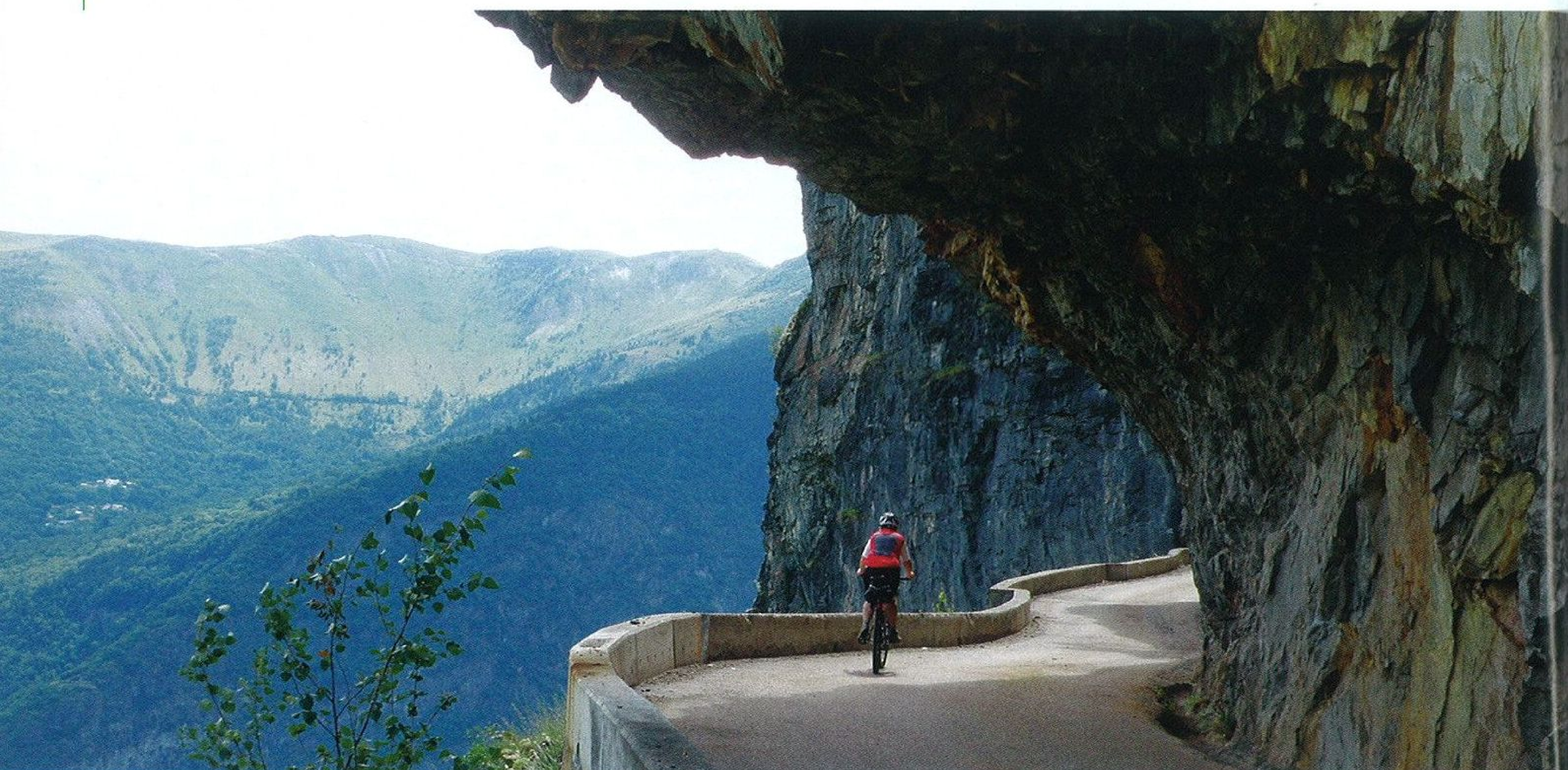
Romantika na prvním místě aneb silnička ke kostelíčku je umně zasekaná do skály

Zapínáme světla a pomalu vyrážíme do tmy. Ta je tu poctivá, neb se tunel vlní. A hlavně je dlouhý. Světla jsme měli oba zadní a kamarádka i přední, tak jsme se orientovali docela dobře. Po chvíli k nám zezadu dolehl hlahol. Šlo o hlasy čtyř silničářů, kteří – jak to tak u těchto cyklistů bývá – vjeli do tmy bez zastavení a bez světla. Musím říci, že před tím, aby do nás nevrátili, nás zachránily dvě věci – jednak naše zadní blikáčky a jednak zatáčka. V ní byla totiž naprostá tma, nebojím se říci temno. Hlahol se tu změnil v dramatické výkřiky. Rozuměl jsem jim. Křičeli