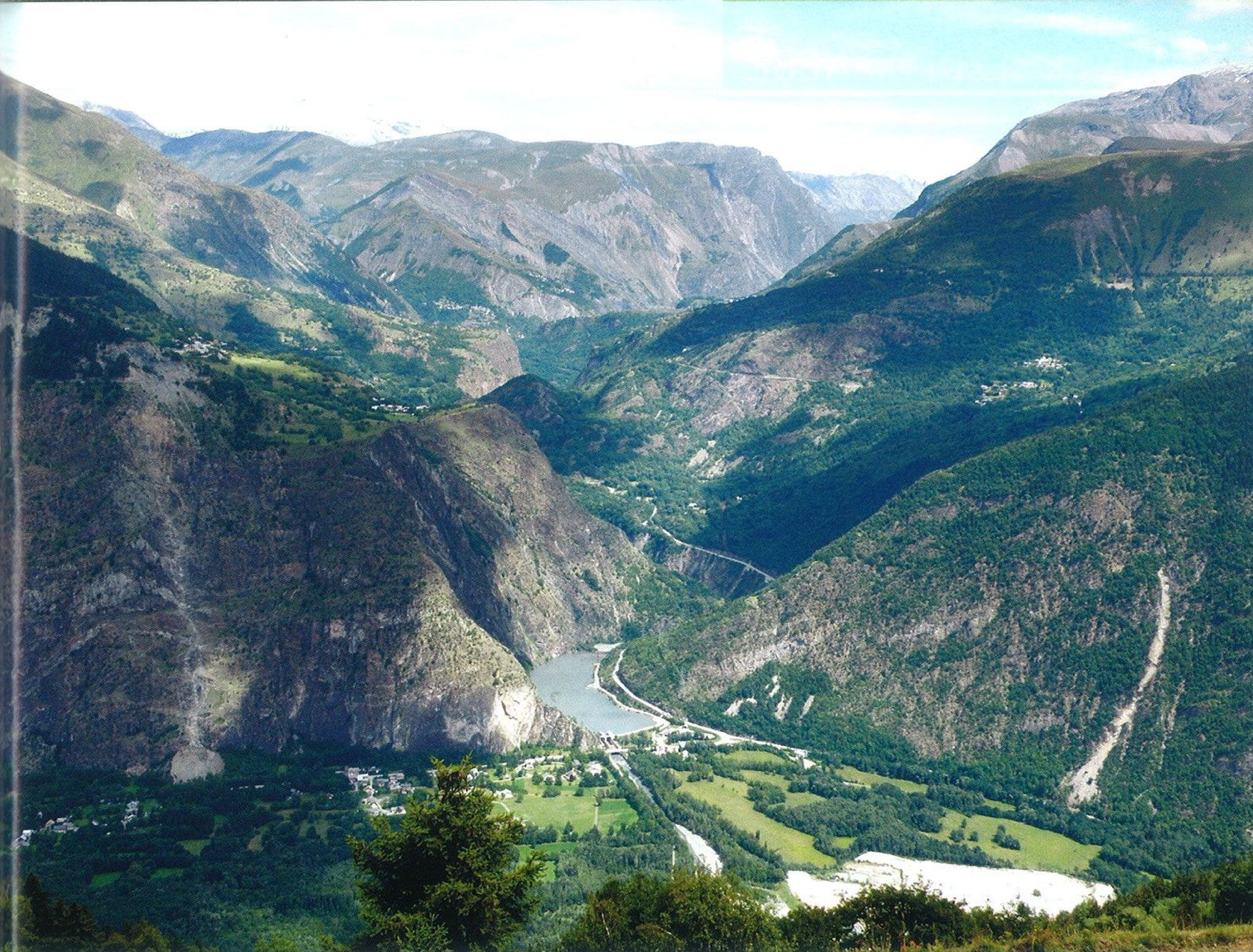
Ohromný výhled, ohromné hory – pohled směrem k le Freney a Besse, dole kolem vody se vine silnice na průsmyk Lautaret

„stopping“ (anglické I am stopping). Vzpomněl jsem si na časy, kdy jsem průvodcoval anglické skupiny. Takhle vždy své okolí varovali, že zastavují. Teď jsem začal křičet také. Pro jistotu. Co kdyby někdo rozjetý měl jiným cyklistou zakrytý výhled, neviděl tak moji blikáčku a sundal mě? A ono se to málem stalo, Angličani zastavili, přesnější výraz je – popadali těsně vedle mě. Abych nepřeháněl, zvládli to bez pádů, ale bylo to o fous. Naše temné setkání pokračovalo společnou chůzí všech šesti lidí zbytkem tunelu. Za ním, venku na světle jsme si aspoň trochu popovídali, načež oni nasedli a vesele si to pelášili dál. Ten den jsme je už nikde neviděli, což nás trochu překvapilo. Ale nepředbíhejme. Naopak, vraťme se k našemu kolegovi, který vyrazil za námi. Taky silničář, taky (jako Angličani) bez světel, zkoušel tunel projet, ale v jednom místě narazil do stěny, na chvíli prý dokonce ztratil orientaci, a tak se rozhodl neriskovat – vrátil se zpátky. To jsme se od něj dověděli až po návratu do kempu. Připadalo mi málo uvěřitelné, že se neodhodlal tunel projít pěšky, případně si počkat na auto (jenže tam jezdí tři až čtyři za celý den). Zřejmě se ale rozhodl, v rámci svých pocitů, rozumně a zodpovědně. Jak známo, bezpečnost a zdraví jsou nade vše.