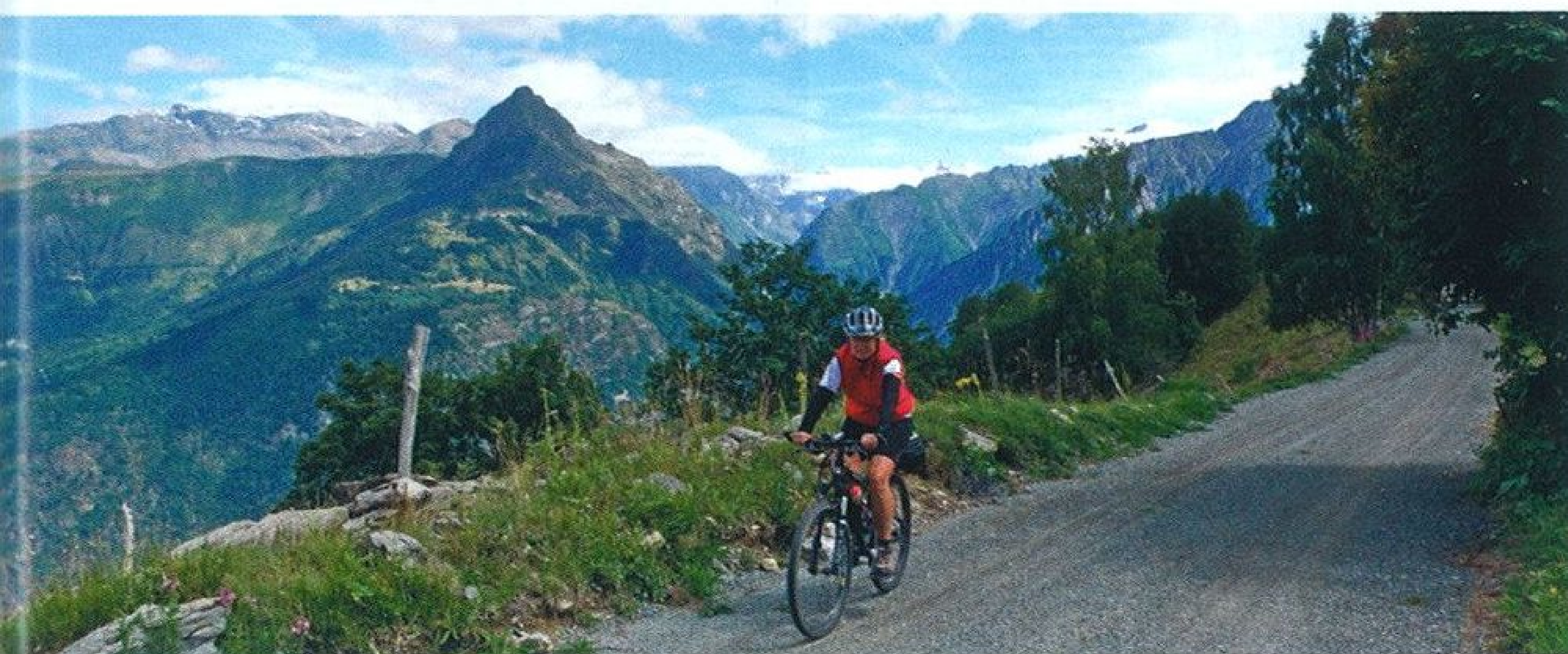
Svezení po hřebenovce je jedna velká radost

německých silničářů, i na nich je vidět spokojenost. Moc jsme toho ještě nesjeli a na jednu musíme zase šlapat. Ale vzápětí se naše silnice spojí s jinou, která vyjíždí přímo z Villard-Reymonda. Nahoru do obce se nám nechce, a tak pokračujeme dál, teď už jen a jen dolů. To jsou radosti – sjezd trvá docela dlouho a není nudný. Proti nám občas jede osamocený cyklista, zpravidla silničář. Vypadá to, že z této strany si „užívají“ stoupání víc než z té naší. Ale zdání kolikrát klame, třeba se jim jede dobře.